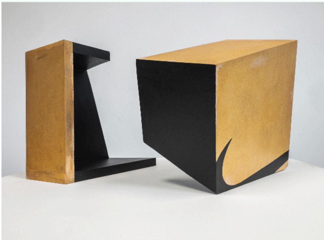
Todos los males del mundo , mdf, resina, acrílico, barniz (medidas variables 45x560x25cm)