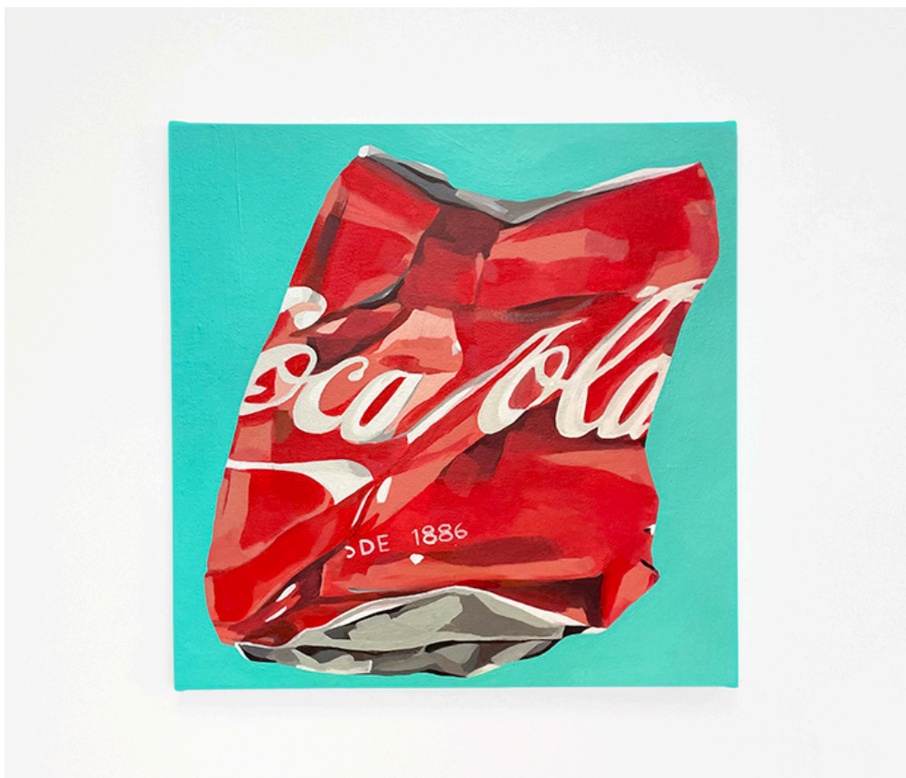
Trash-cola, acrílico sobre lino, 41,5x41,5cm.