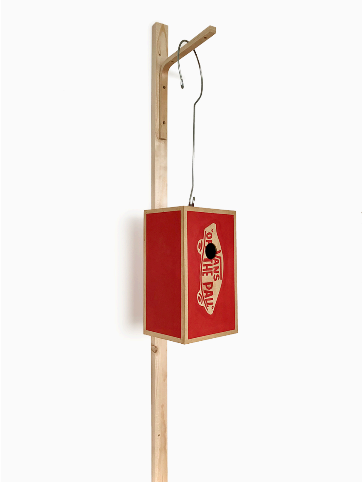
Off the Pall , mdf, madera, acero inoxidable, pintura acrílica y barniz (180x21x16cm)