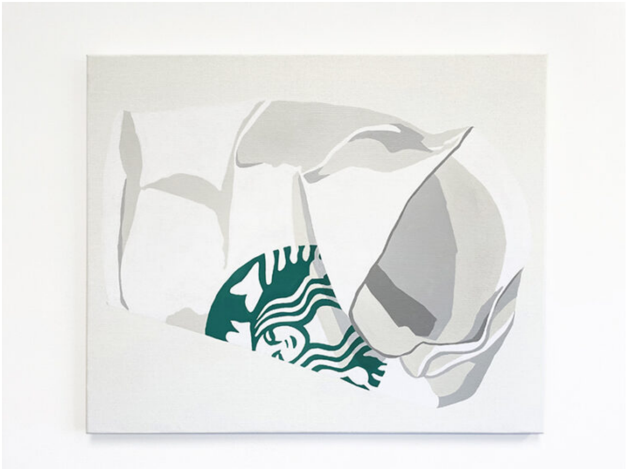
Greenvertiser. Acrílico sobre lino 75x55cm