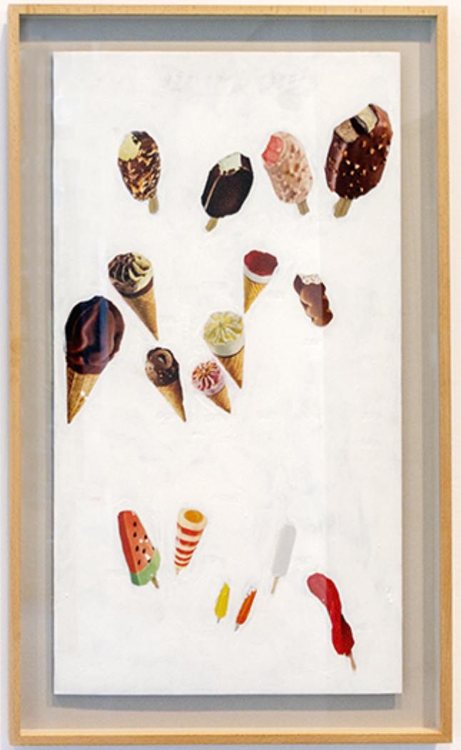
Apolo. Solo quedan los que están sin tachar.