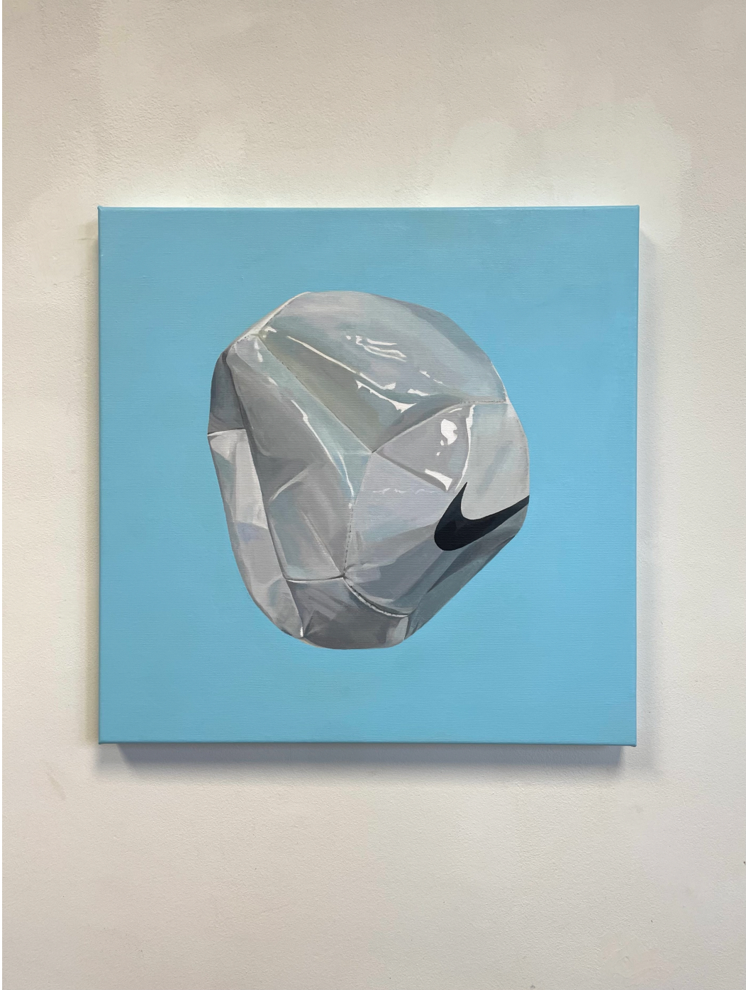
Pangea. Acrílico sobre lino 50x50cm