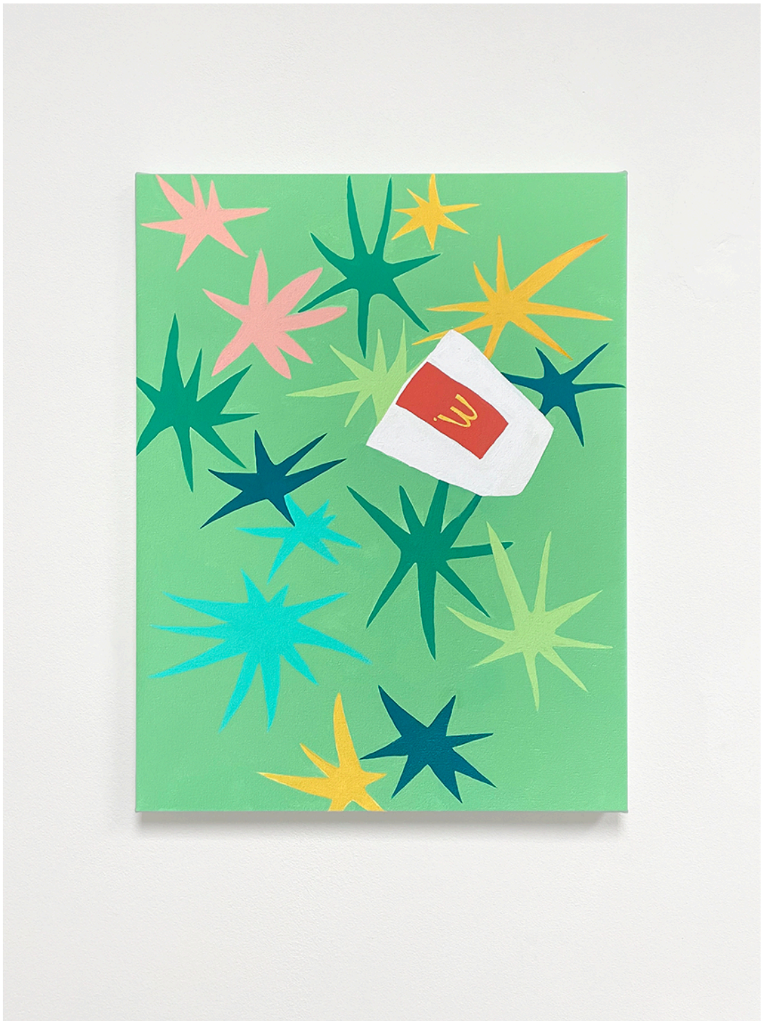
McTrash , acrílico sobre lino (55x41,5cm)