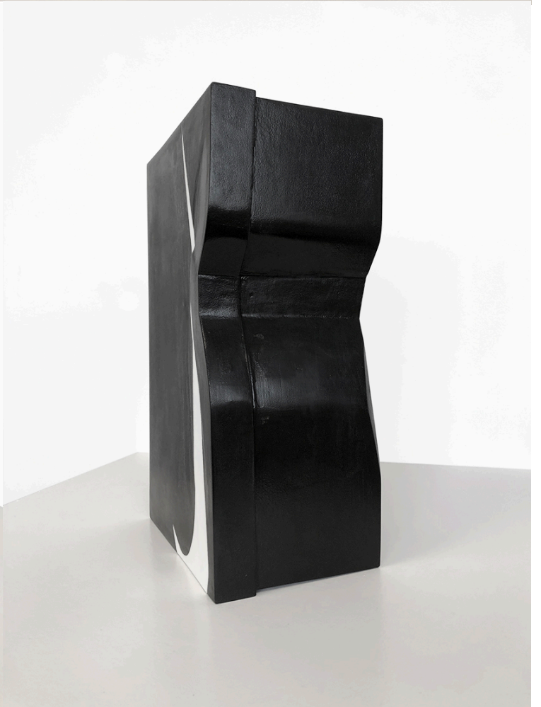
Zeus Cabrón! , mdf, madera de pino, resina, pintura acrílica y barniz (31x21x19cm)