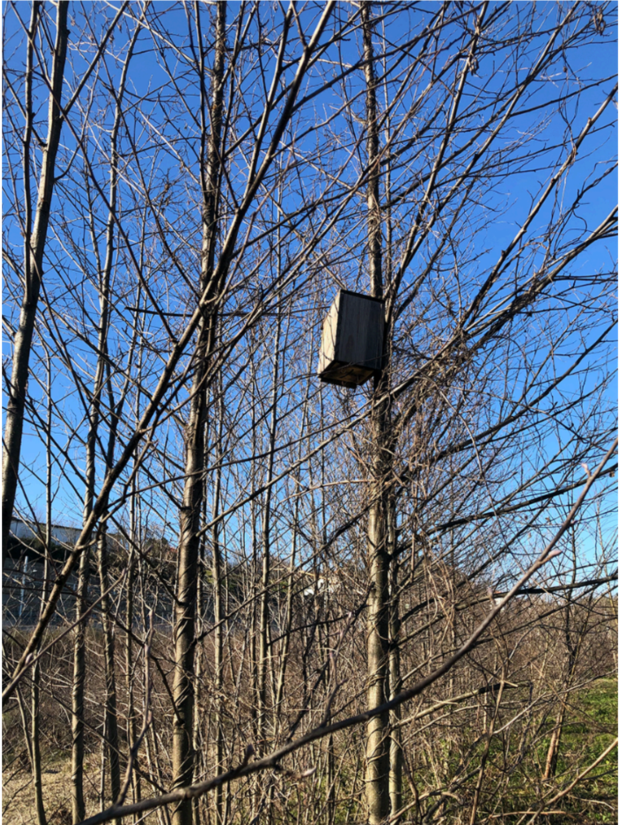
La casa. Caseta para pájaros encontrada