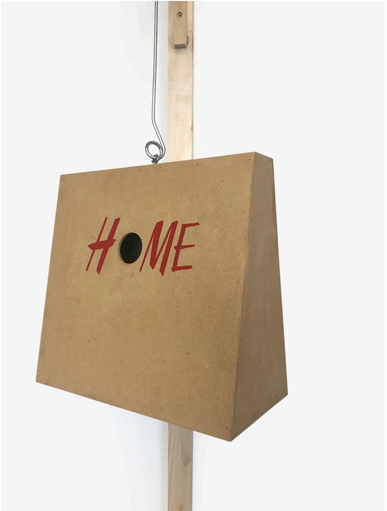
Hennes & Mauritz Suite , mdf, madera, acero inoxidable, pintura acrílica y barniz (180x23x16cm)