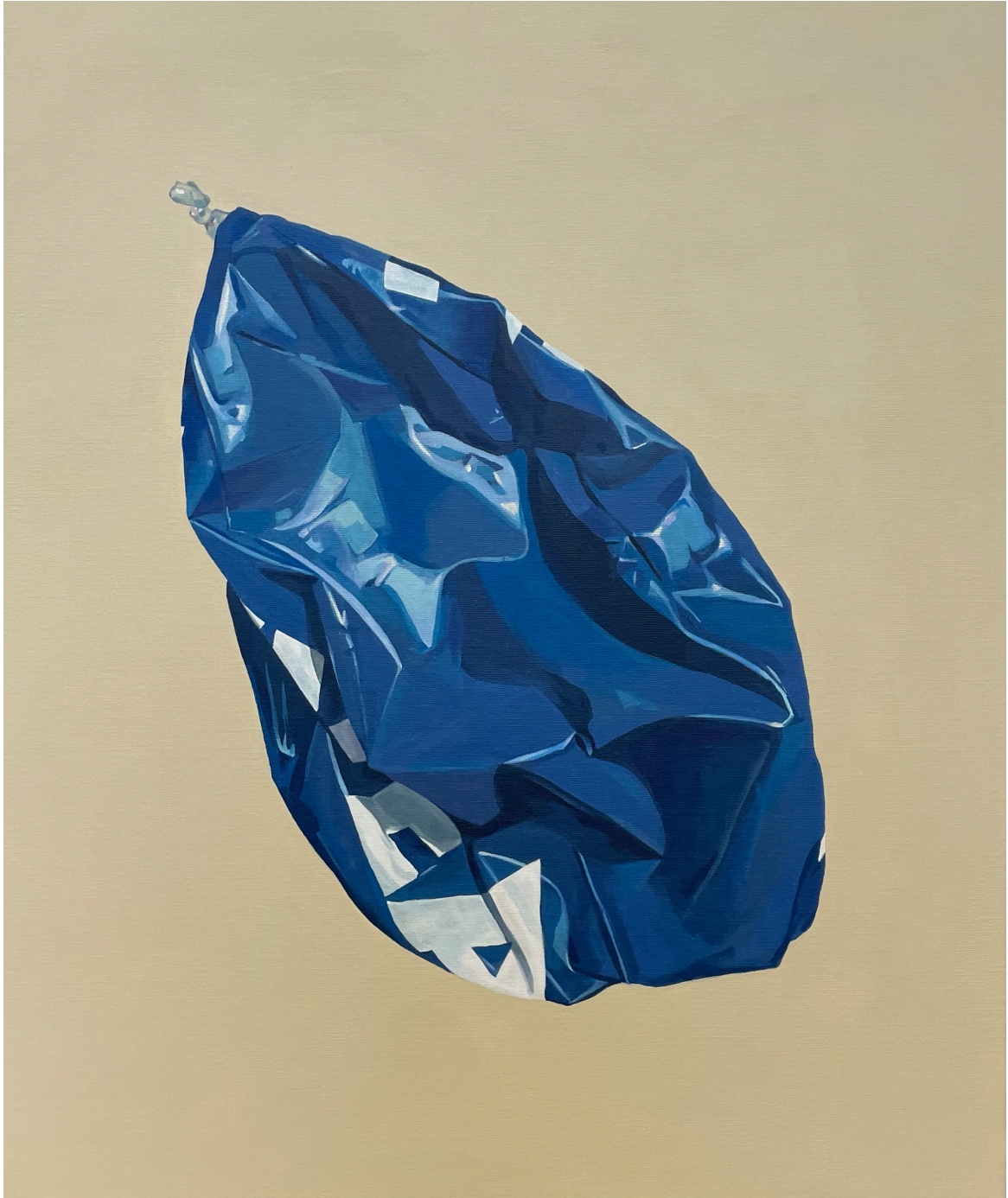
Sin título. Acrílico sobre lino 65x55cm