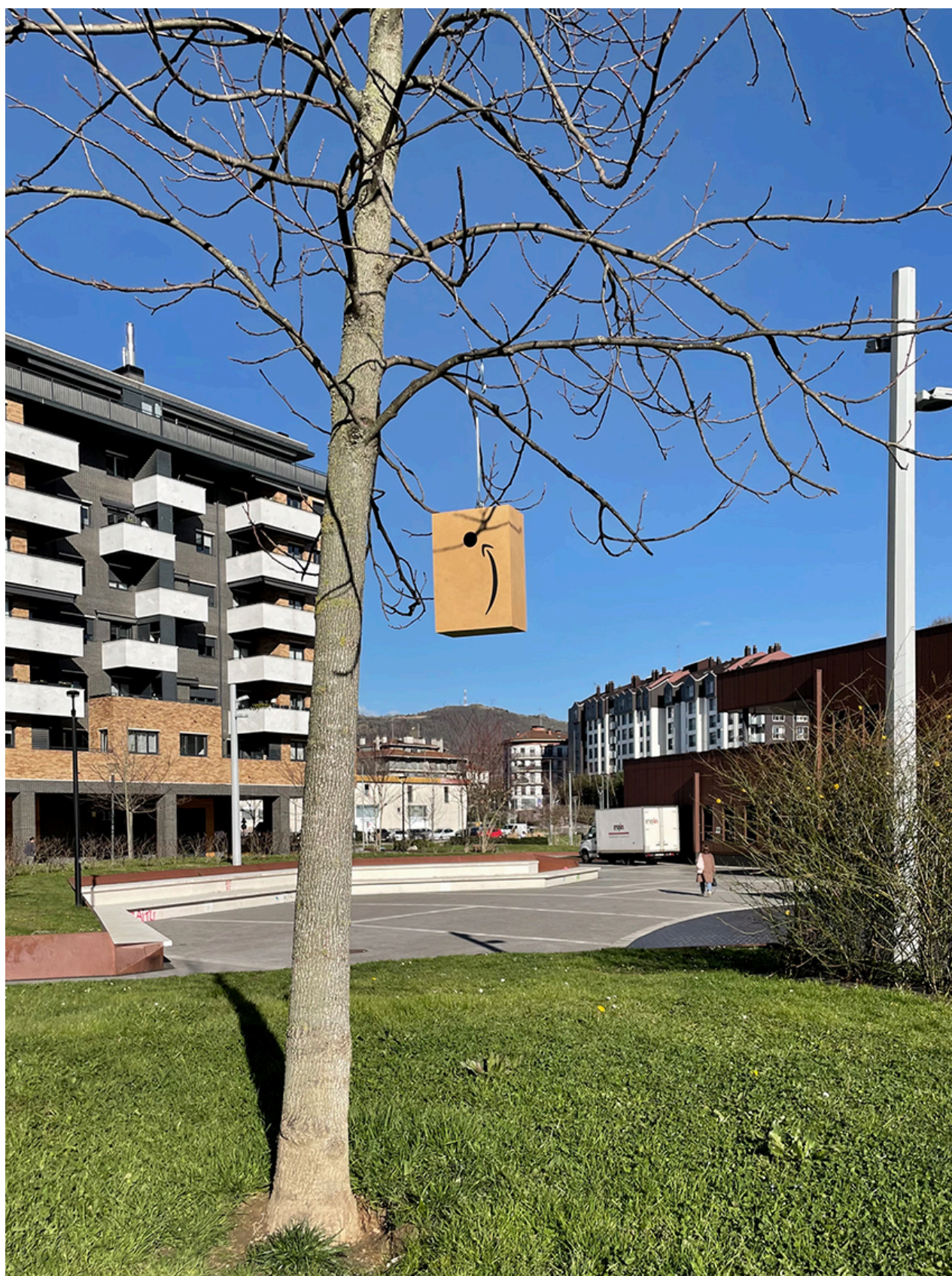
Amahome (intervención pública)