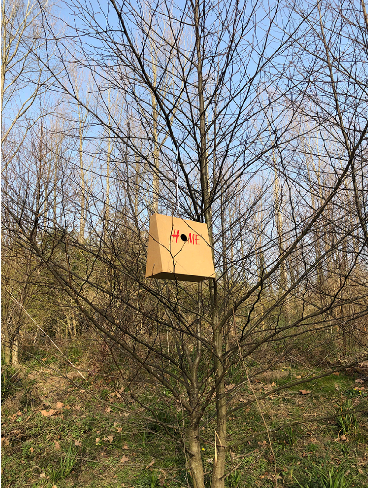
Hennes & Mauritz Suite, intervención pública