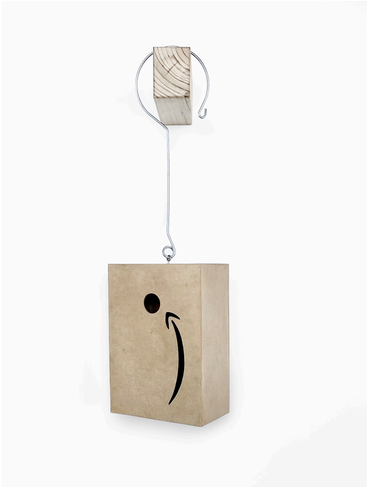
Amahome , mdf, madera, acero inoxidable, pintura acrílica y barniz (80x20x16cm)