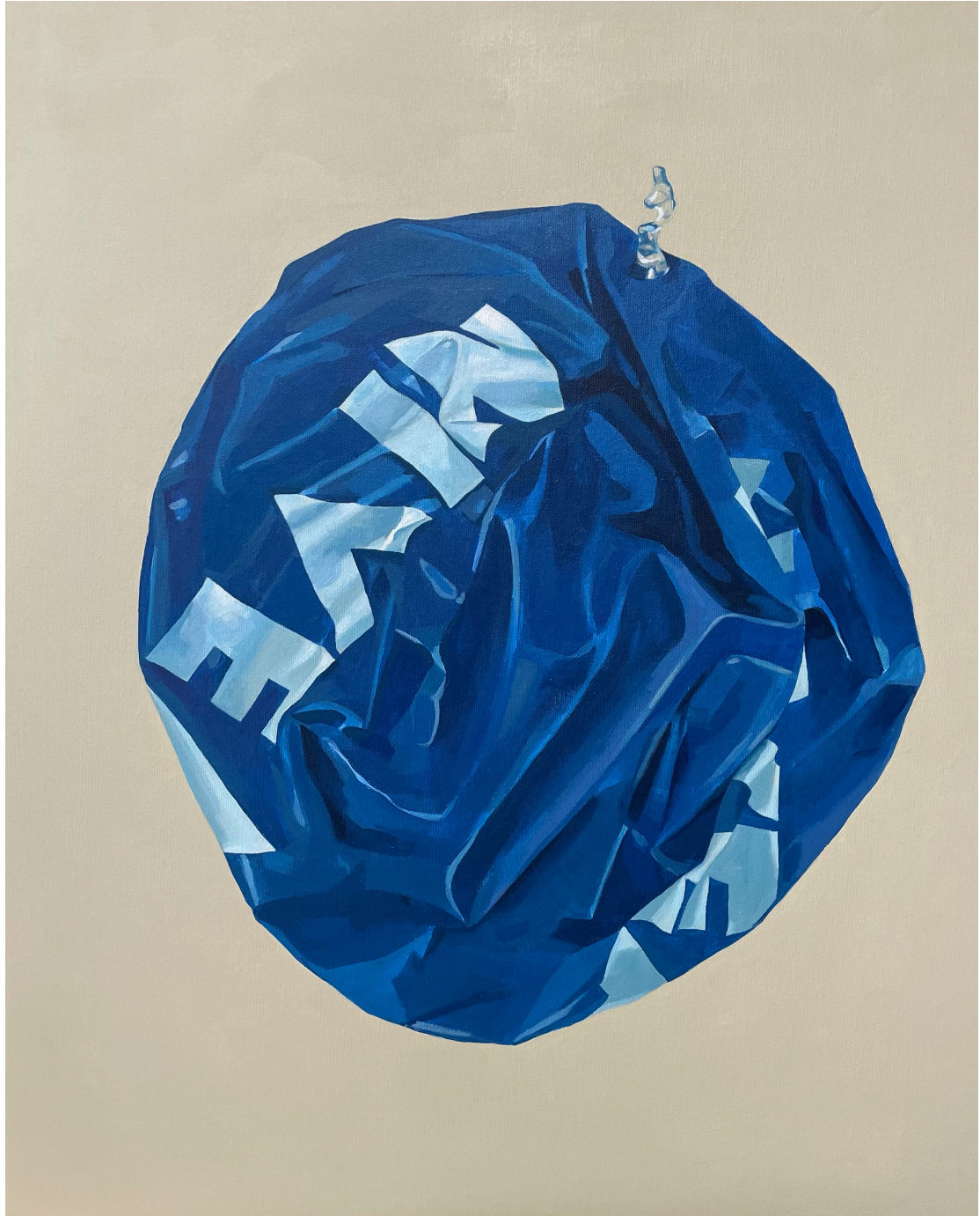
Sin título. Acrílico sobre lino 65x55cm