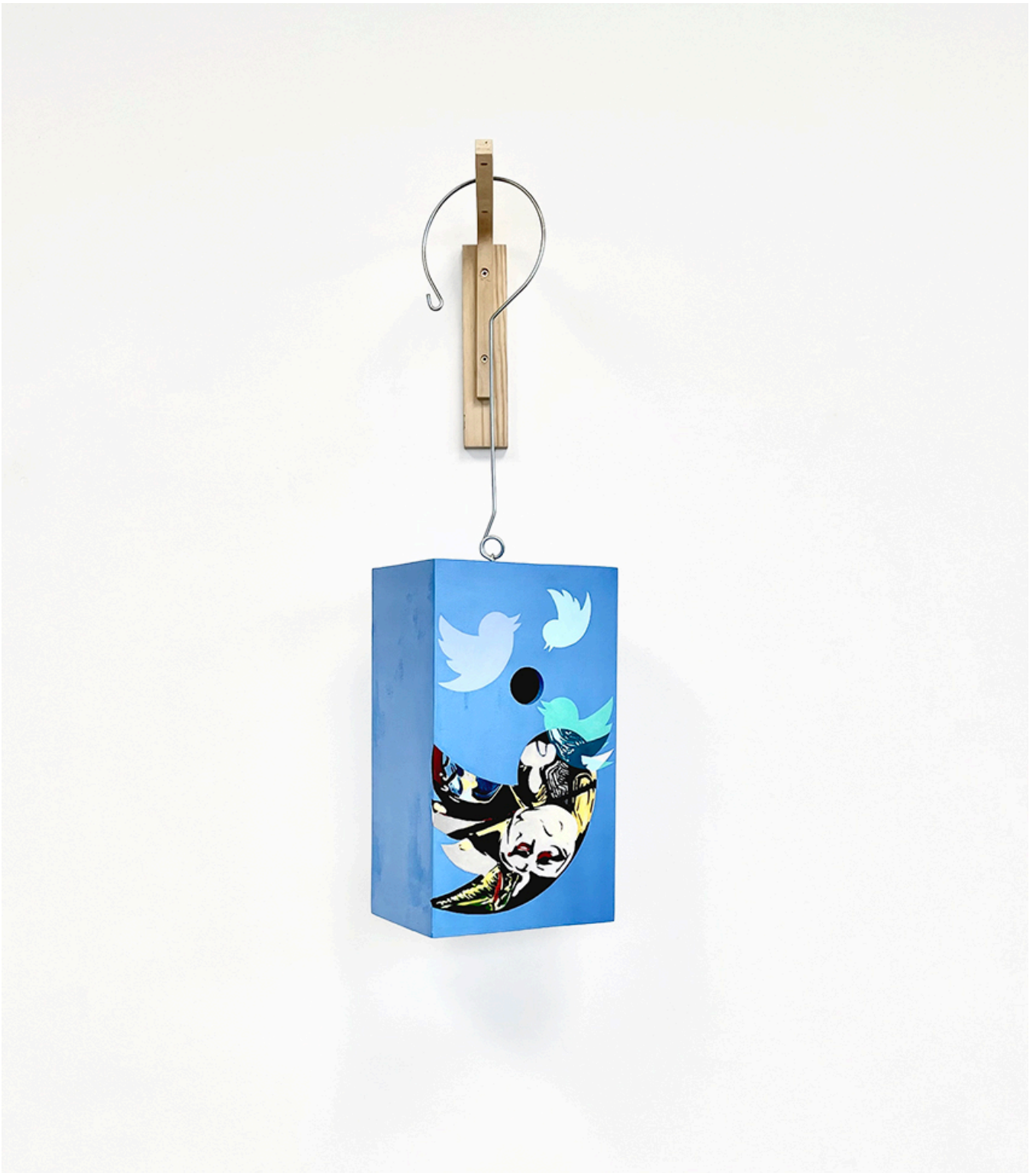
Bat Hiru (Musk-erade)